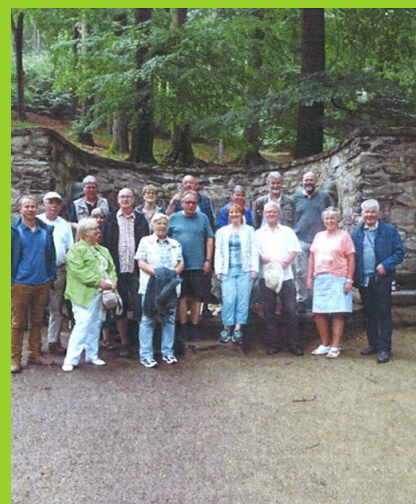
Exkursion zur Spreequelle

Dann ging es im Juni zu den Quellen der Spree ins sächsische Bautzen. Hier standen der Spreespeicher 1, die Talsperre Bautzen und die Wasserkunst auf dem Exkursionsprogramm.