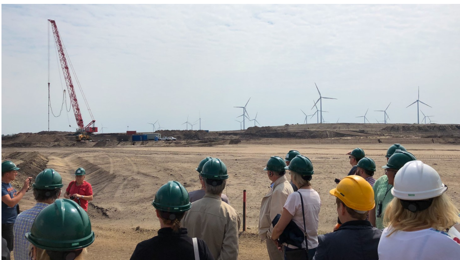
Jahresfachexkursion Tagebau Cottbus-Nord