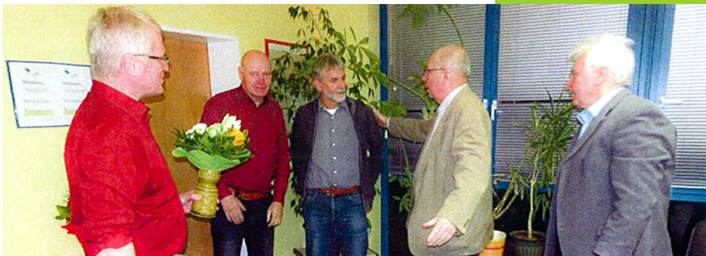
Vorstandswahl Frankfurt (Oder)