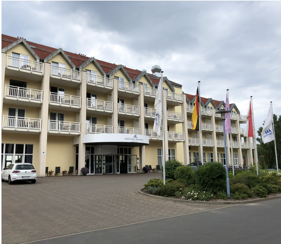
Maritim Hafenhotel Rheinsberg