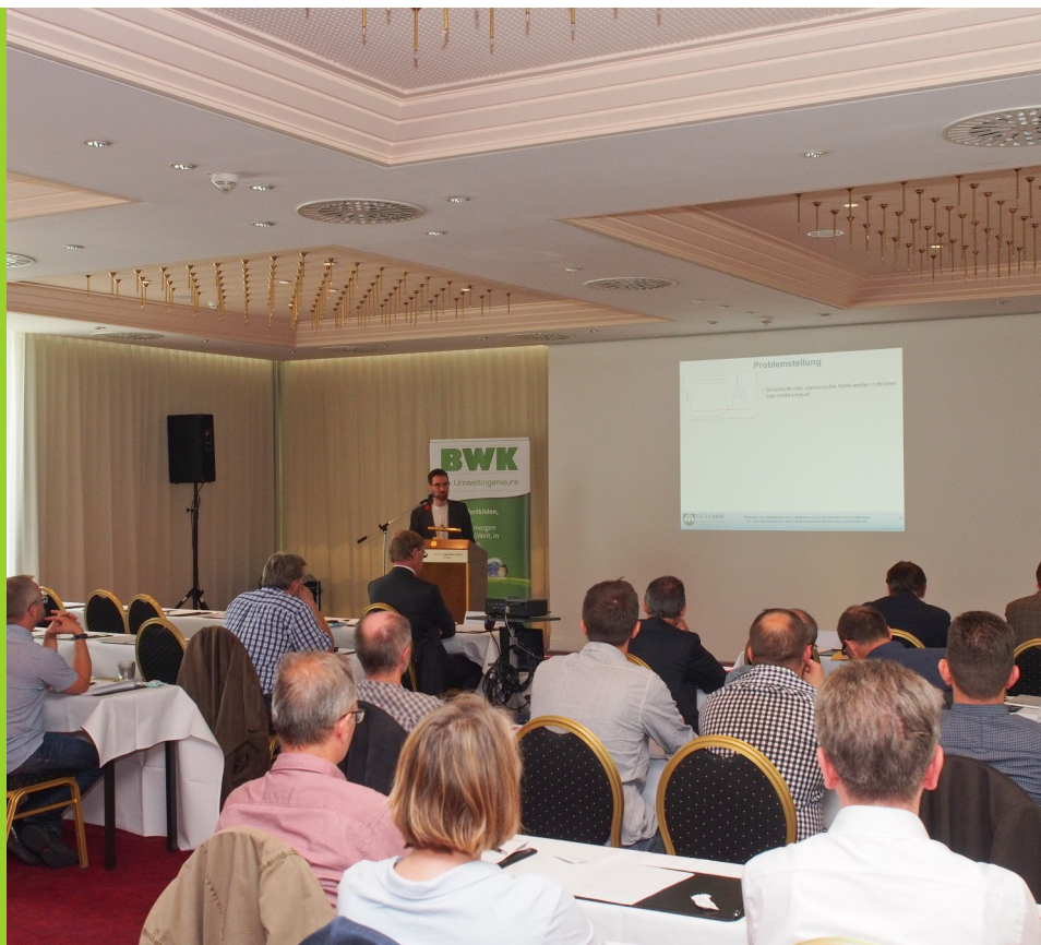
Thema des 25. Jahreskongresses: „Grundwasser, Sanierung und Bewirtschaftung“